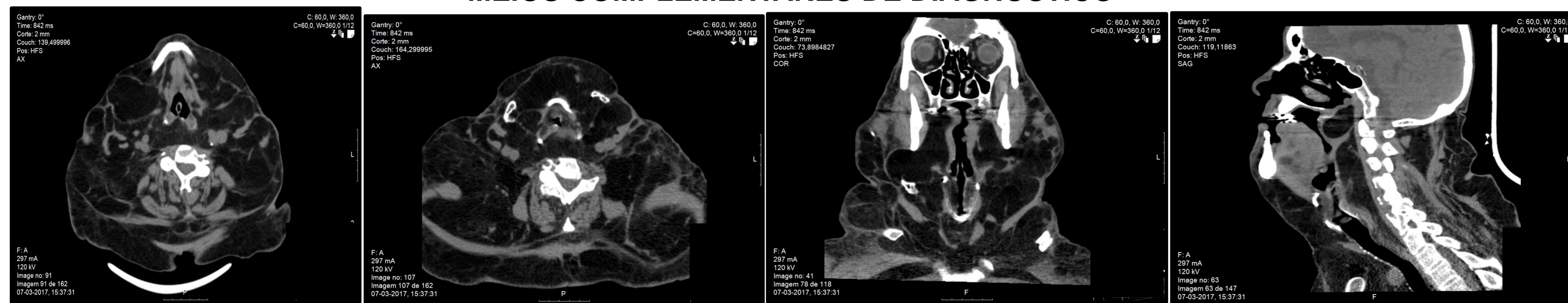
Fig 6-9. Realizou TAC cervical que mostrou "extenso infiltrado adiposo do pescoço supra e infra-hioideu com extensão às regiões axilares e interescapulares, provocando importante deformação do trato aerodigestivo, especialmente da faringe; palato mole redundante com colapso da orofaringe e importante deformação das glândulas salivares com envolvimento do feixe carotídeo-jugular."