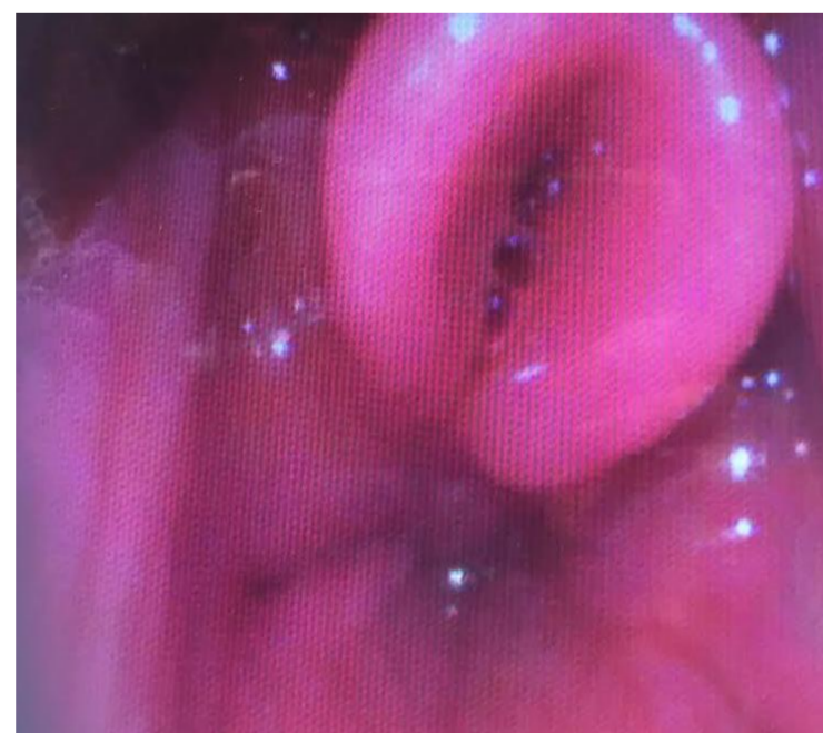
Fig. 10. Mallampati classe IV; Fig 11. Entubação oro-traqueal sob visualização com videolaringoscópio C-MAC®.

→ Pós-operatório: resolução das queixas do doente