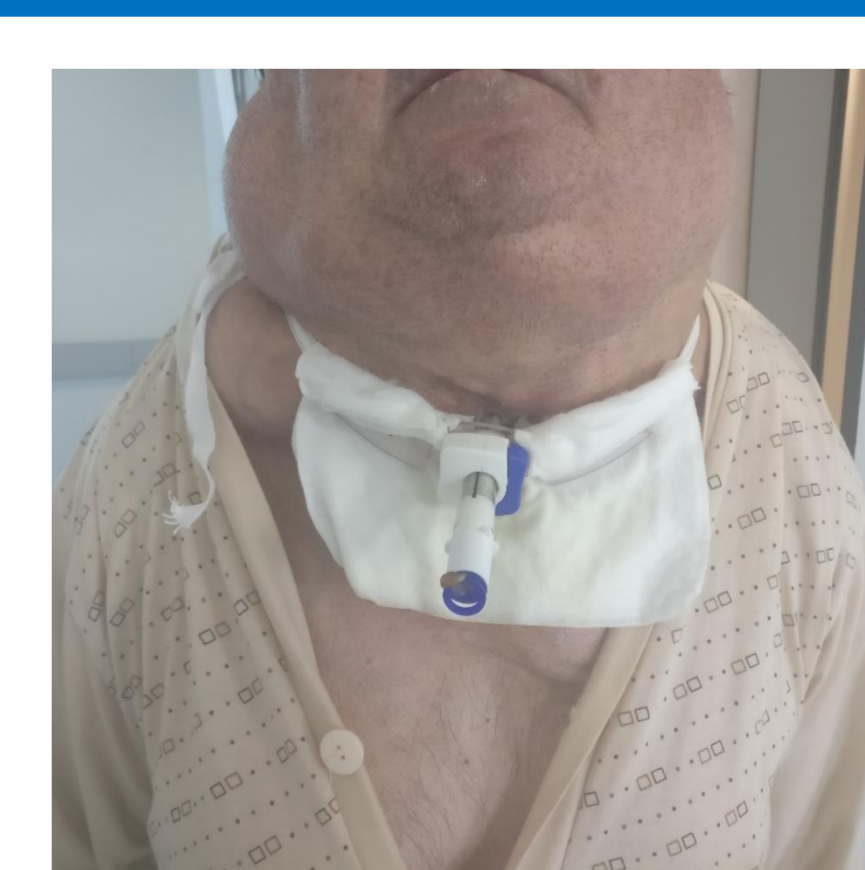
Fig. 13. Cânula ajustável PORTEX® nº 8