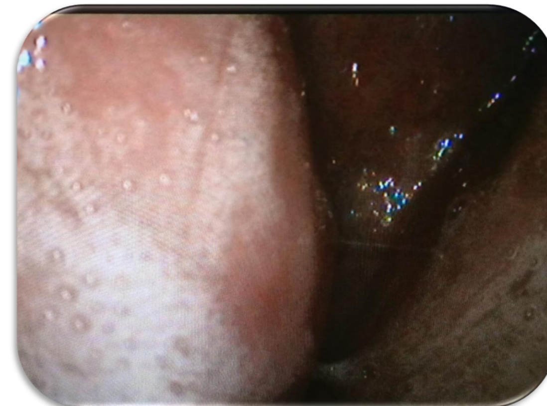
Fig. 3-5. Nasofibrolaringocopia à admissão revela abaulamento marcado das paredes postero-laterais da nasofaringe, hipertrofia da amígdala lingual com apagamento das valéculas, colapso dos seios piriformes, epiglote em ómega, edema e rubor marcados com diminuição marcada do lúmen das vias aéreas superiores e exsudado faringolaríngeo em placa.